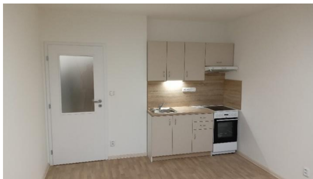
Byt po rekonstrukci