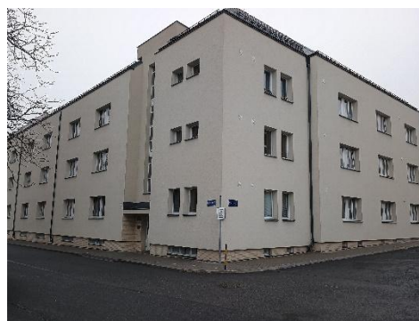
Masarykovo nám. 650/11