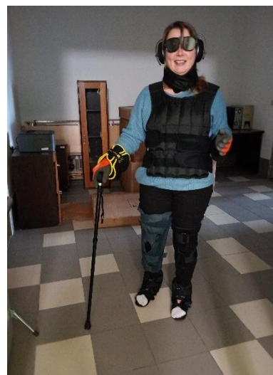
Školení pomocí virtuální reality

Všichni pracovníci organizace jsou pravidelně školeni jak v oblastech daných zákonem (povinné školení pracovníků v sociálních službách 24 hodin ročně podle zákona č. 108/2006 Sb., o sociálních službách, školení BOZP, PO, energetický management, ochrana osobních údajů a školení řidičů pro používání služebních vozidel), tak i v dalších oblastech podle měnící se legislativy (účetnictví, personalistika, hmotný majetek, správa bytů apod.). Zaměstnanci organizace měli možnost zúčastnit se dalšího zážitkového kurzu zaměřeného na porozumění seniorům a osobám s těžkým zdravotním postižením. Jedinou zkušeností bylo vyzkoušení speciálního gerontoobleku, který simuluje pohyb a pocity starších či zdravotně postižených lidí. Díky tomuto zážitku mohou pracovníci lépe porozumět omezením, únavě i potřebám těch, o které každodenně pečují. Kurz tak přinesl nejen nové poznatky, ale i hlubší empatii a porozumění vůči uživatelům pečovatelské a odlehčovací služby.