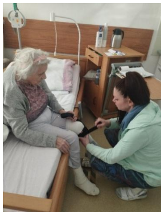
Rehabilitace na odlehčovací službě

V tomto roce byla domácí zdravotní péče poskytnuta 144 klientům, z toho 54 mužům a 90 ženám. Věková hranice našich klientů se pohybovala od 52 do 96 let a celkem bylo provedeno 16 914 návštěv. Úzce spolupracujeme rovněž s odlehčovací službou naší organizace. Koordinace mezi zdravotními sestrami a pečovatelkami je klíčová jak při sestavování individuálního plánu péče, tak při řešení nečekaných situací. Přítomnost zdravotních sester na úseku odlehčovací služby zvyšuje komfort uživatelů a zároveň kvalitu poskytované sociální služby. Někteří klienti pokračují v domácí zdravotní péči i po návratu do svého domácího prostředí.