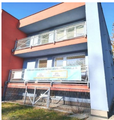
Azylový dům a noclehárna

Dodržování provozního řádu a stanovených pravidel je proto nezbytnou podmínkou řádného poskytování služby. Zaměstnanci důsledně dbají na prevenci rizikového chování, adekvátně řeší konfliktní situace a přijímají potřebná opatření k ochraně zdraví a bezpečnosti všech přítomných osob. Poskytovaná služba tak kromě zajištění základních životních potřeb systematicky usiluje rovněž o postupné posilování motivace klientů, podporu jejich samostatnosti a vyhledávání možností další sociální stabilizace a začlenění.