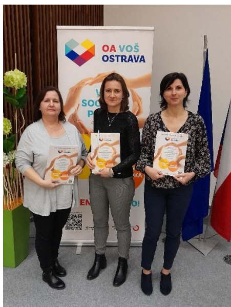
Využití umělé inteligence

Vedoucí zaměstnanci se zúčastnili konference na téma "Využití umělé inteligence v sociálních službách", seznámili se mnohými projekty využívajícími AI k uspokojování potřeb klientů sociálních služeb. Diskutovalo se o rizicích využívání umělé inteligence a kybernetické bezpečnosti včetně digitalizace sociálních služeb.