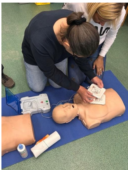
Školení první pomoci