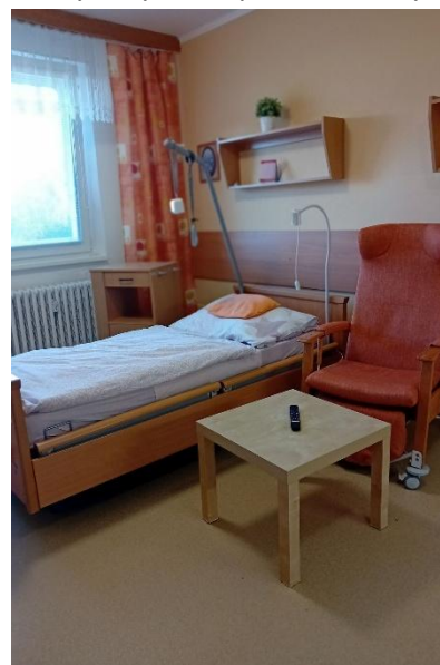
Jednolůžkový pokoj - Domovinka

V roce 2025 byly vybudovány dvě nové jednolůžkové domovinky, které rozšiřují možnosti moderního a individuálního ubytování pro klienty. Cílem projektu bylo vytvořit prostředí s vyšší mírou soukromí, pohodlí a domácí atmosféry, a zároveň zachovat dostupnost všech potřebných služeb a odborné péče. Realizací projektu nedošlo ke změně celkové kapacity služby. K jejímu vzniku bylo využito stávajících prostor, jejichž účel byl nově upraven tak, aby lépe odpovídal současným potřebám klientů i trendům v poskytování sociálních služeb. Úpravy zahrnovaly dispoziční změny, modernizaci vybavení a přizpůsobení prostor tak, aby podporovaly větší samostatnost a individuální způsob života klientů. Nové domovinky jsou koncipovány s důrazem na bezpečnost, bezbariérovost a funkčnost. Menší, přehledné prostředí umožňuje klientům zachovat si vlastní denní režim a soukromí, zároveň však zůstává zajištěna plná dostupnost podpory ze strany personálu. Prostory jsou navrženy tak, aby podporovaly samostatnost klientů, jejich orientaci i pocit jistoty. Součástí konceptu je také vytváření domácí atmosféry, která přispívá k psychické pohodě a důstojnému způsobu života.