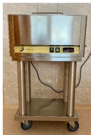
Přístroj na termoterapii