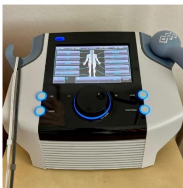
Přístroj na elektroléčbu

Positivní vliv na lepší výsledky rehabilitace má postupná modernizace přístrojového vybavení. V roce 2025 jsme na oddělení pořídili dva nové přístroje. První z nich je kombinovaný terapeutický přístroj umožňující dvoukanálovou elektroléčbu s širokým spektrem proudů současně s ultrazvukem. Druhý přístroj pak nabízí termoterapii s rašelinovými nosiči tepla a nahrazuje tak vysloužilou parafínovou lázeň.