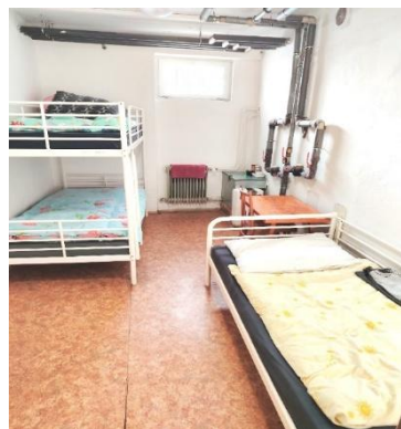
Noclehárna - lůžka