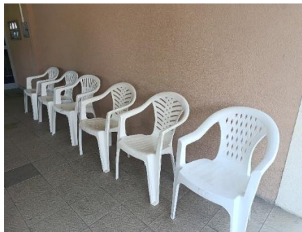
Vybavení pro nájemníky