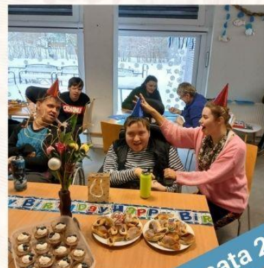
Franata 25 let