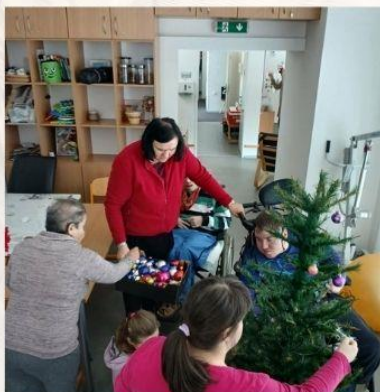
Rozloučení s Vánocemi